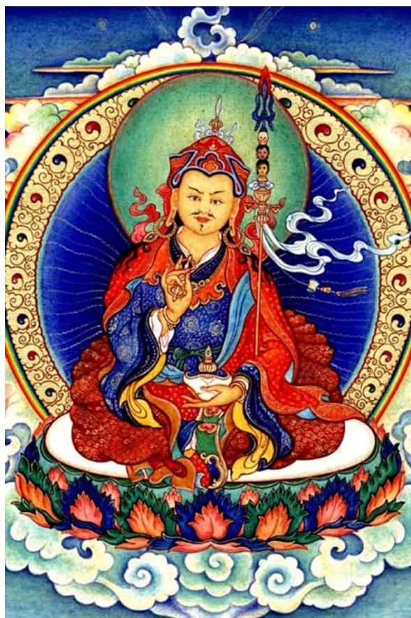
威武忿怒的持明, 貝瑪特聽札

嗡梭滴！山丘烟供是取自拉尊的“持明成就者的生命力量”的指導。要準備一些吉祥物,例如上等的木材、熏香、藥品、三白和三甜的物品、麵粉等。將它們放在乾淨的容器或爐子裏；撒水淨化,點燃吉祥的火來燃燒這些物品做火供。