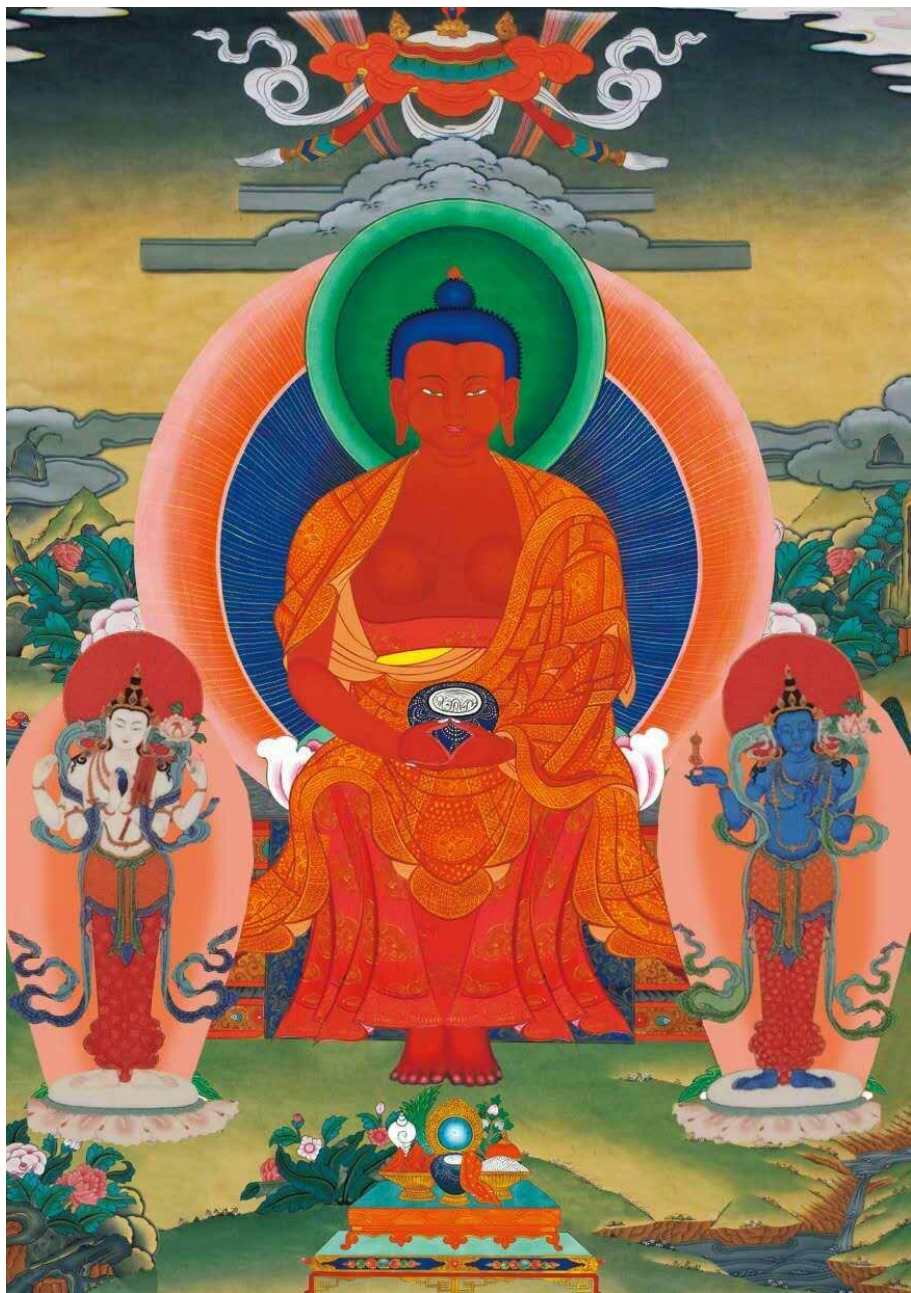
阿彌陀佛(頗哇觀想圖)